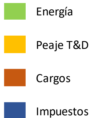
Con discriminación horaria