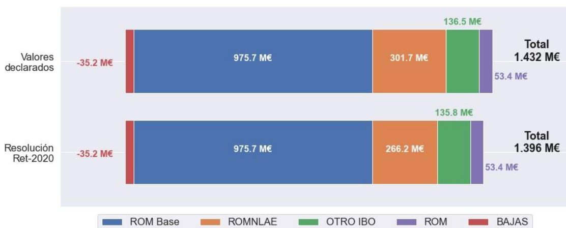
Gráfico 1. Comparativa entre los conceptos que componen el término COMGES considerados en la presente resolución y el valor declarado por las empresas.

Los principales impactos son derivados del proceso de inspección y de la revisión de la información remitida por las empresas distribuidoras en el segundo trámite de audiencia (ROMNLAE y OTRO IBO), como se ha detallado a lo largo del presente anexo.